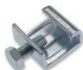
SKC Pince de serrage