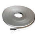
GAS-M1 Joint mousse