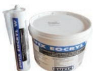
EOCRYL M1 Mastic acrylique