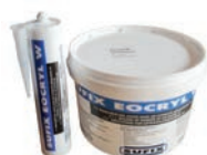
EOCRYL M1 Mastic acrylique