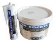
EOCRYL M1 Mastic acrylique 1 / 1 FR-FR SGJ - 2020/01/08 O