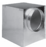
REP Plénum de raccordement avec piquage latéral